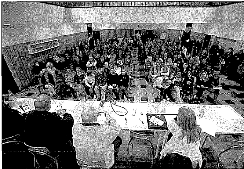
200 engasjerte foreldre, elever og lærere deltok på folkemøtet 27. oktober. Politikerne stilte også, untatt Ap og SV, som på riksplan sitter med både kunnskapsminister og minister for forskning og høyere utdanning.

Valgkretsene Saltrød og Eydehavn har tradisjonelt vært blant Arbeiderpartiets beste valgkretser. Når folk stadig vekk opplever at partiet ikke prioriterer Stuenes, svikter de sine egne.